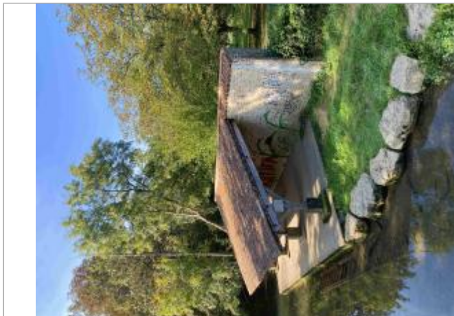
Vue sur le lavoir