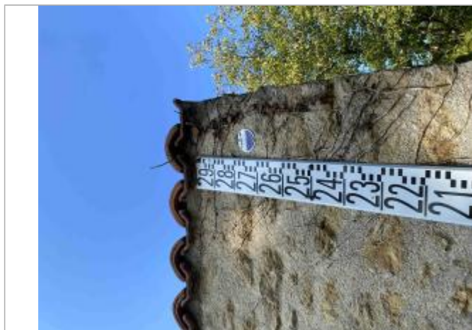
Vue sur l'échelle limnimétrique et le macaron

Altitude calculée de l'eau (en m) : 79.24