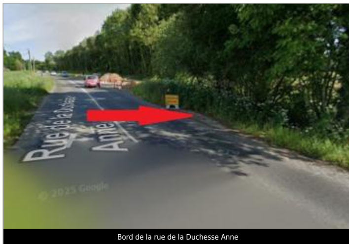
Bord de la rue de la Duchesse Anne

Coordonnées WGS84 : X: -1.67791616 / Y: 48.14990440