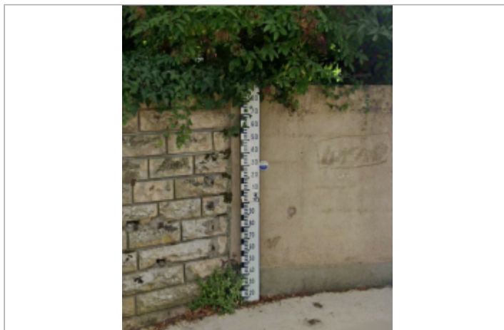
Mur support du repère