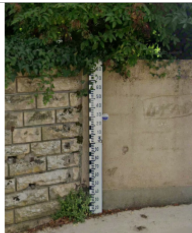
Mur support du repère