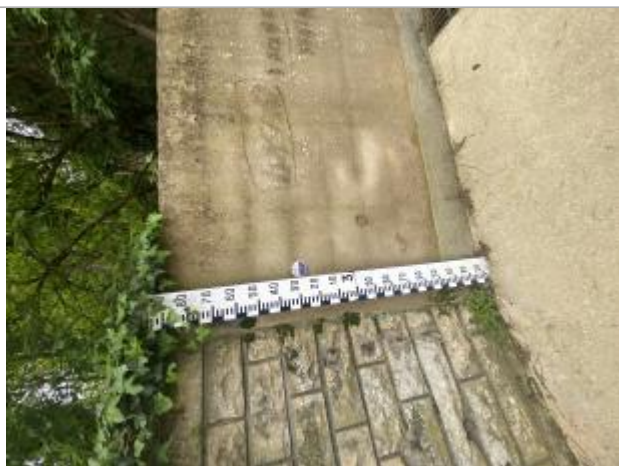
Vue sur l'échelle et le macaron

Altitude calculée de l'eau (en m) : 79.2 m