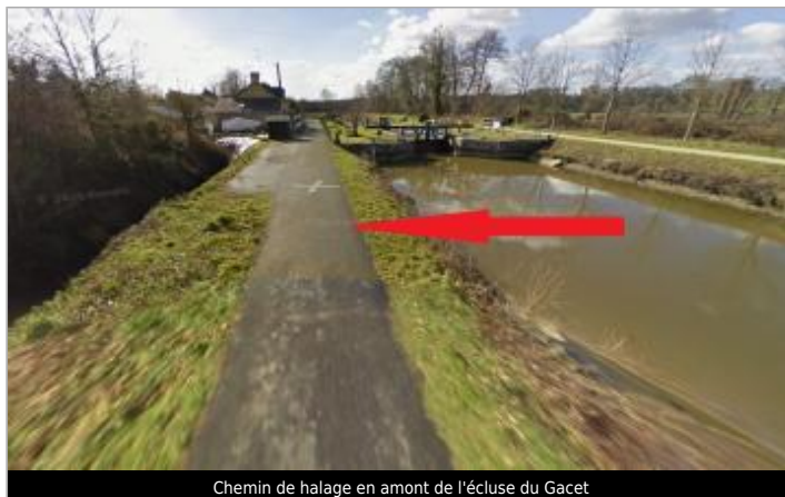
Chemin de halage en amont de l'écluse du Gacet