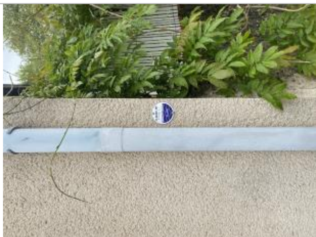
Vue sur le macaron