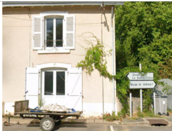
Macaron - extrémité droite de l'habitation (site)