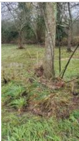
laisse d'inondation sur le tronc d'un arbre bordant le chemin

Altitude calculée de l'eau (en m) : 32.829 m