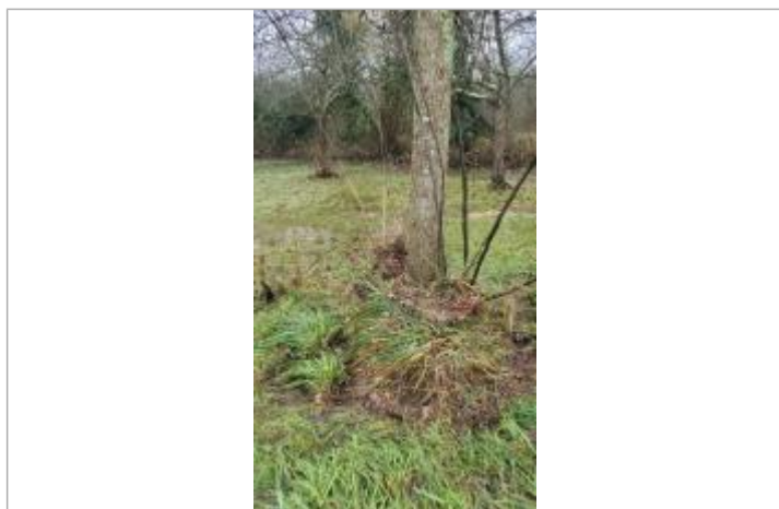
laisse d'inondation sur le tronc d'un arbre bordant le chemin

Altitude calculée de l'eau (en m) : 32.829 m