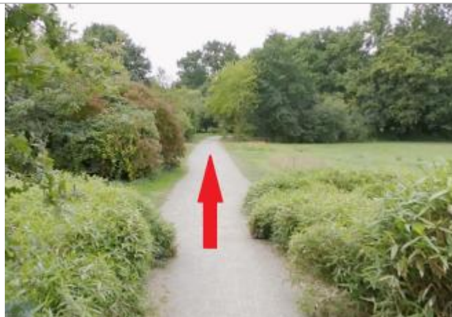
chemin dans le parc de l'Ille