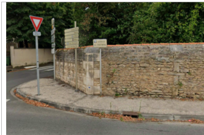
Vue sur le mur (support d'un macaron)