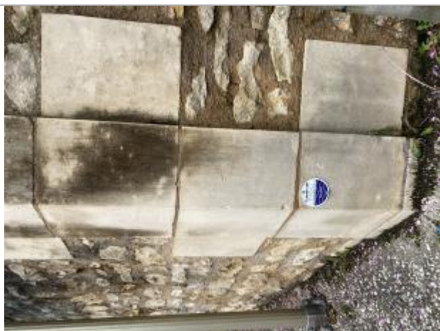
Vue sur le macaron

Altitude calculée de l'eau (en m) : 79.2