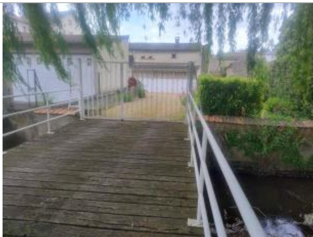
Vue sur le terrain (face au garage)

Altitude calculée de l'eau (en m) : 105.76 m