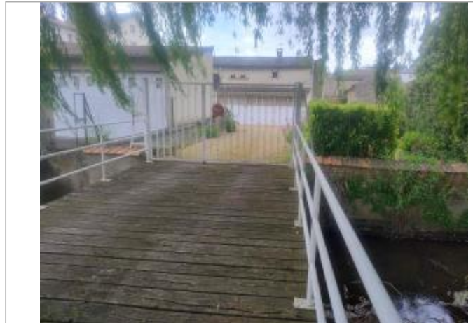
Vue sur le terrain - niveau garage

Coordonnées WGS84 : X: 0.16592700 / Y: 46.63935300