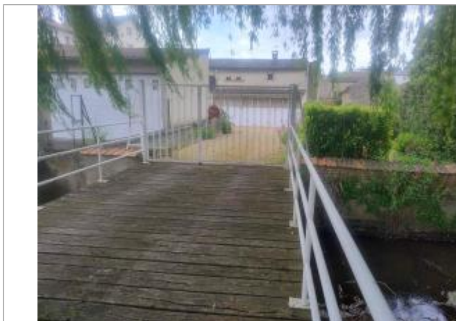
Vue sur le terrain - niveau garage