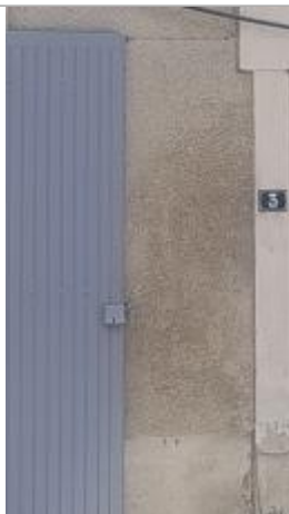
Vue sur la façade

Altitude calculée de l'eau (en m) : 106.12 m