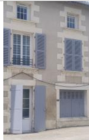
Vue sur la façade d'habitation