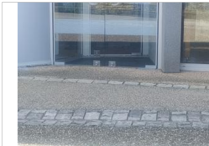
Vue sur le seuil de la mairie

Altitude calculée de l'eau (en m) : 106.43 m