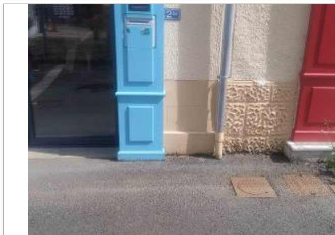
Zoom sur la façade (anciennement laboratoire du Boucher)

Altitude calculée de l'eau (en m) : 105.97 m