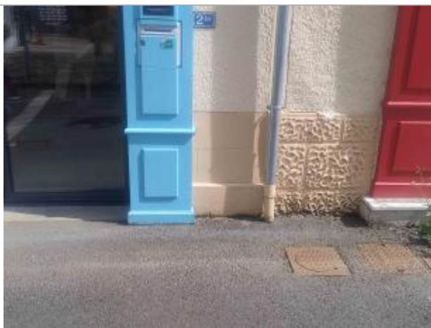
Zoom sur la façade (anciennement laboratoire du Boucher)

Altitude calculée de l'eau (en m) : 105.97 m