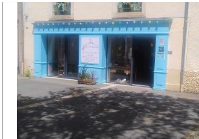
Vue sur la façade

Coordonnées WGS84 : X: 0.16486100 / Y: 46.63860300