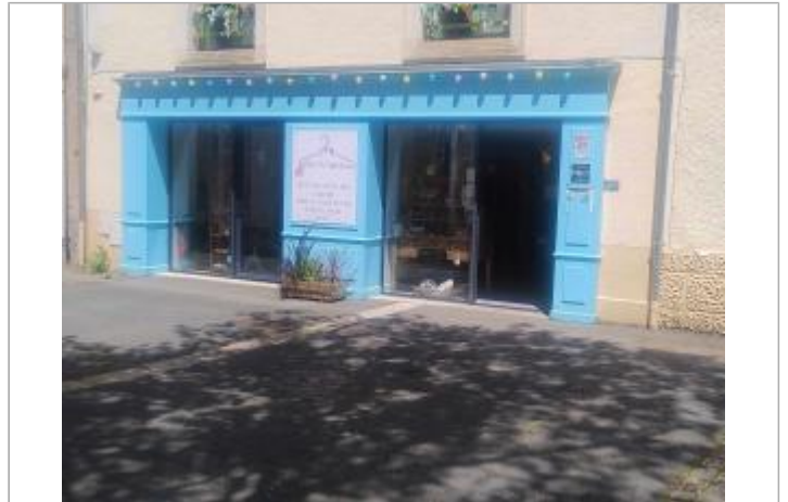
Vue sur la façade