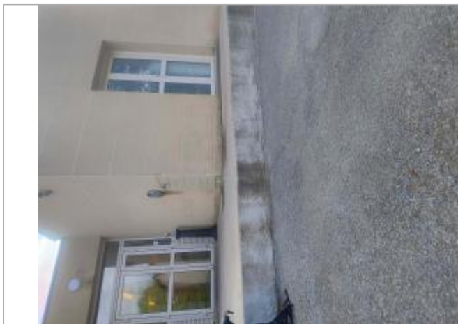
Vue sur la façade arrière du restaurant