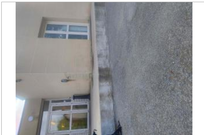
Vue sur la façade arrière du restaurant