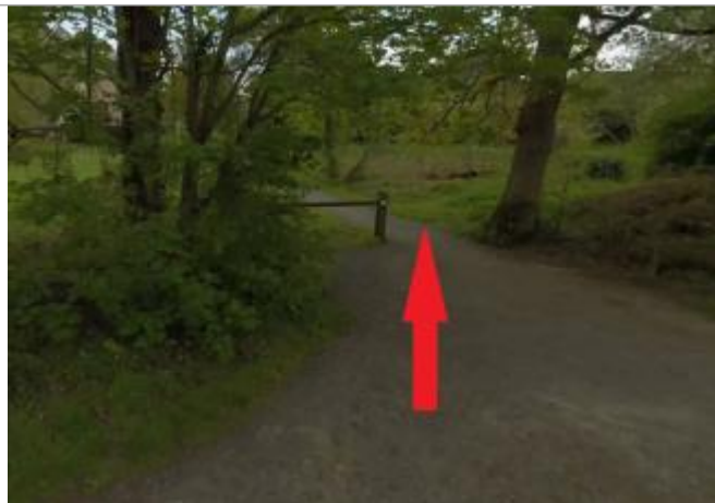
Au niveau de la barrière, chemin débouchant sur le halage

Coordonnées WGS84 : X: -1.64137783 / Y: 48.17673840