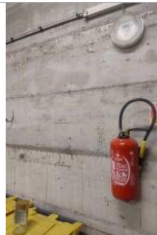
Vue du mur portant des traces de feutre