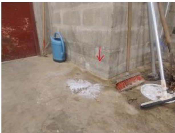
Vue sur la laisse d'inondation

Organisme : Etablissement public du bassin de la Vienne