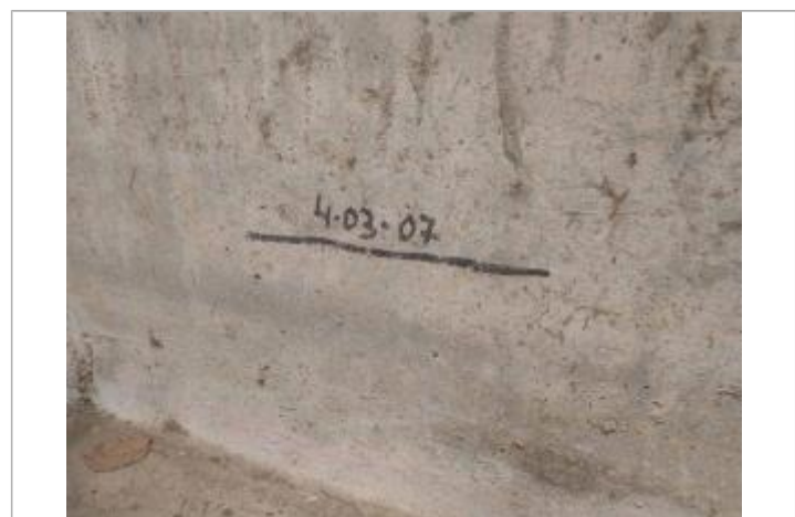
Vue sur la marque de feutre

GÉNÉRAL Code : STBE05 Date de mise à jour : 26/11/2025 Auteur : EPTB_Vienne