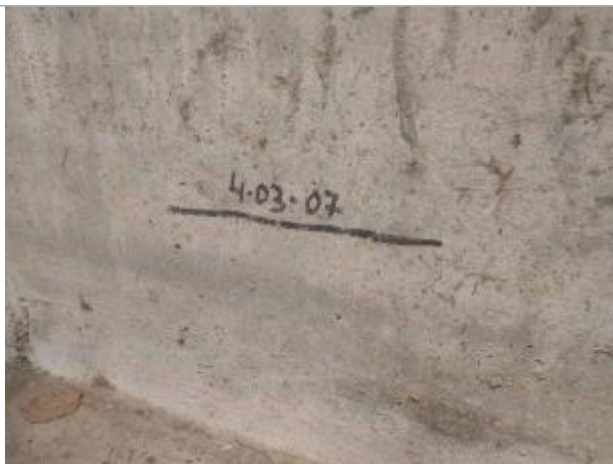
Vue sur la marque de feutre

Organisme : Etablissement public du bassin de la Vienne