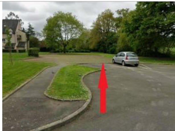
Parking au bout de l'allée du pigeon blanc