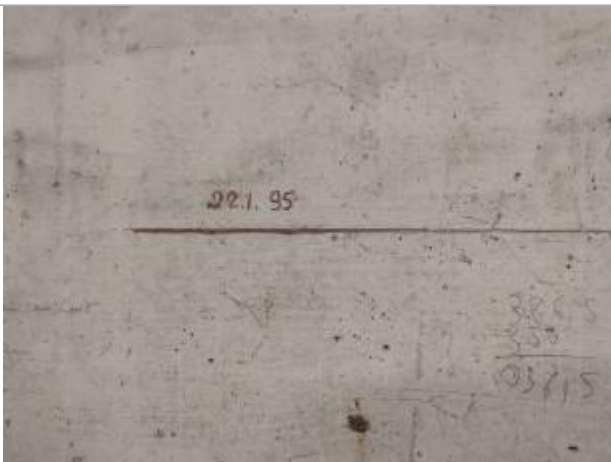
Trace au feutre (peinture)

Organisme : Etablissement public du bassin de la Vienne