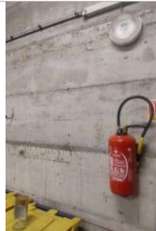
Vue du mur portant des traces de feutre