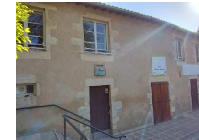
Façade base de canoë-Kayak

Coordonnées WGS84 : X: 0.33481969 / Y: 46.55029030