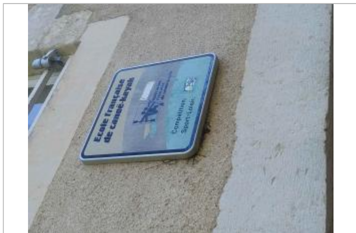
Vue sur débris végétaux (1982)

SOURCE DE REPÉRAGE : RECENSEMENT DES REPÈRES DE CRUES PAR L'EPTB VIENNE - PHASE OPÉRATIONNELLE DU PAPI VIENNE-CLAIN - 22/04/2024