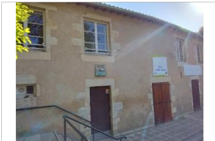
Façade base de canoë-Kayak