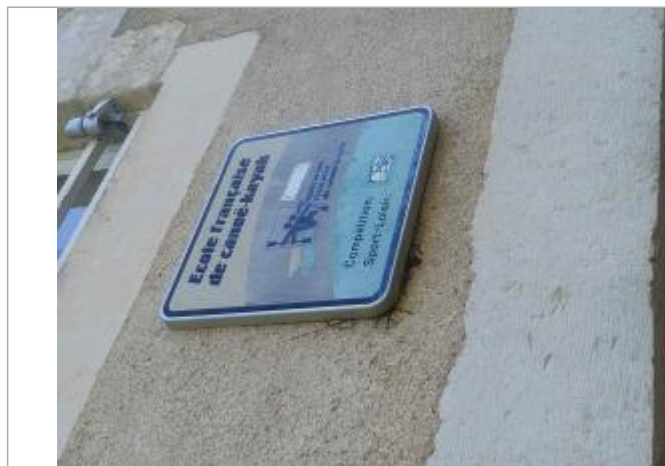
Vue sur débris végétaux (1982)

SOURCE DE REPÉRAGE : RECENSEMENT DES REPÈRES DE CRUES PAR L'EPTB VIENNE - PHASE OPÉRATIONNELLE DU PAPI VIENNE-CLAIN - 22/04/2024