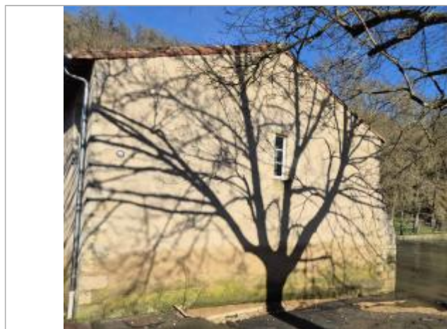
Repère sur l'angle sud est du bâtiment principal de la base nautique