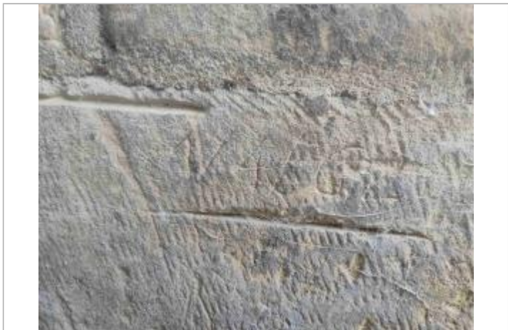
Marque d'avril 1962

GÉNÉRAL Code : BEAU09 Date de mise à jour : 26/11/2025 Auteur : EPTB_Vienne