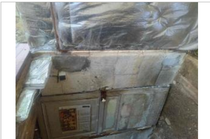
Pilier avec inscriptions gravées

GÉOLOCALISATION Coordonnées WGS84 : X: 0.44300872 / Y: 46.72416530 Coordonnées RGF93 (Lambert 93) X: 504745.27 / Y: 6628057.03 Coordonnées RGF93 (ETRS89) : X: 0.4430087 / Y: 46.7241653 Code Hydro: L2--0160 Rive de référence: Droite