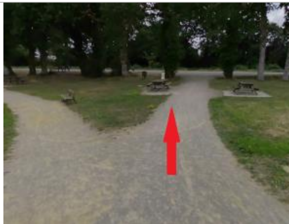
Tables de pique-nique près du plan d'eau (photo Harry Trib en août 2025)