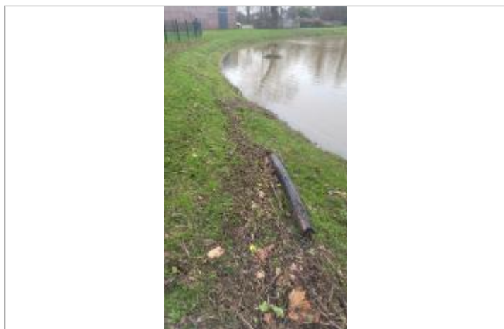
Bord du plan d'eau près de l'aire de jeux