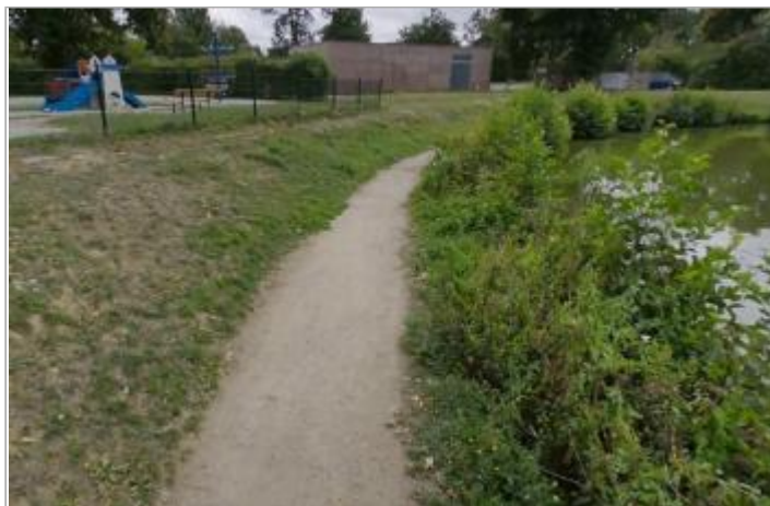
Bord du plan d'eau près de l'aire de jeux (photo Harry Trib en août 2025)