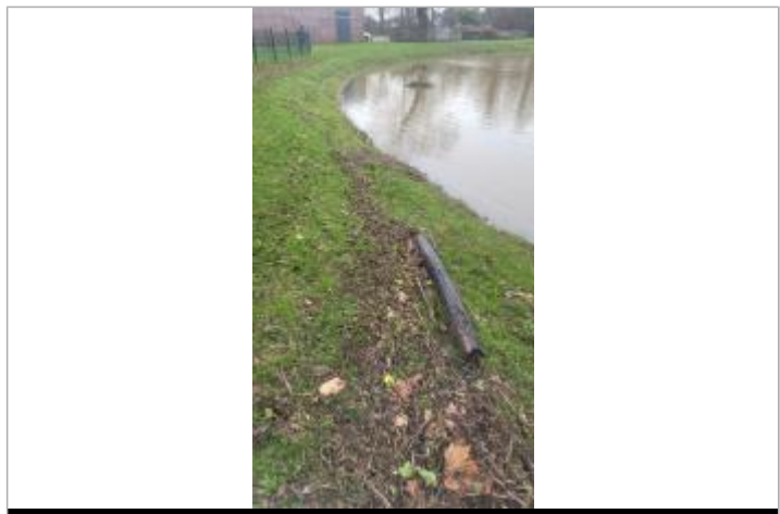
Bord du plan d'eau près de l'aire de jeux

GÉNÉRAL Code : SPC_35024_006_2025 Date de mise à jour : 23/09/2025 Auteur : SPC VCB