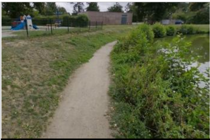
Bord du plan d'eau près de l'aire de jeux (photo Harry Trib en août 2025)

GÉOLOCALISATION Coordonnées WGS84 : X: -1.64126376 / Y: 48.17982190 Coordonnées RGF93 (Lambert 93) X: 355229.64 / Y: 6796742.44 Coordonnées RGF93 (ETRS89) : X: -1.6412638 / Y: 48.1798219 Code Hydro: J71-0300 Rive de référence: Gauche