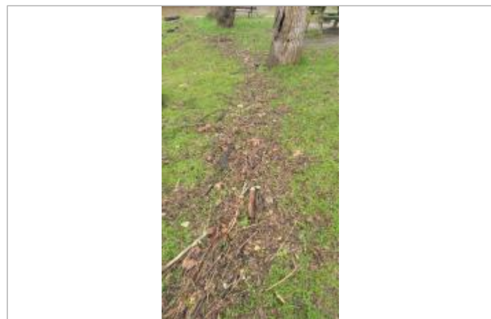
Talus arboré le long des plans d'eau près du chemin du buisson

GÉNÉRAL Code : SPC_35024_004_2025 Date de mise à jour : 23/09/2025 Auteur : SPC VCB