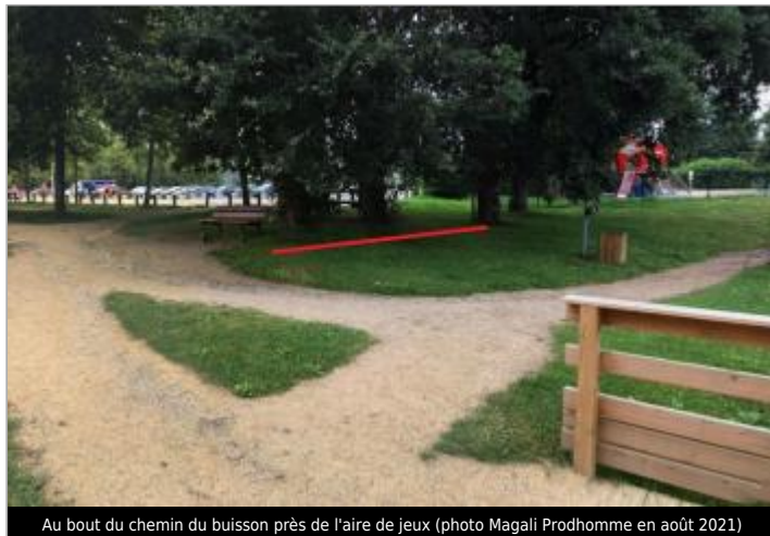
Au bout du chemin du buisson près de l'aire de jeux

Coordonnées WGS84 : X: -1.64153995 / Y: 48.17991890