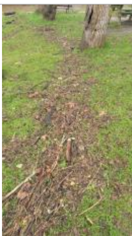
Talus arboré le long des plans d'eau près du chemin du buisson

Altitude calculée de l'eau (en m) : 32.792