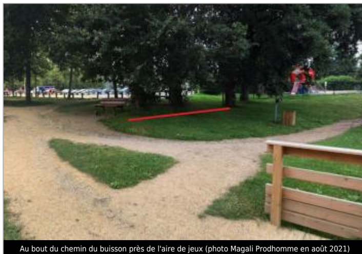
Au bout du chemin du buisson près de l'aire de jeux (photo Magali Prodhomme en août 2021)