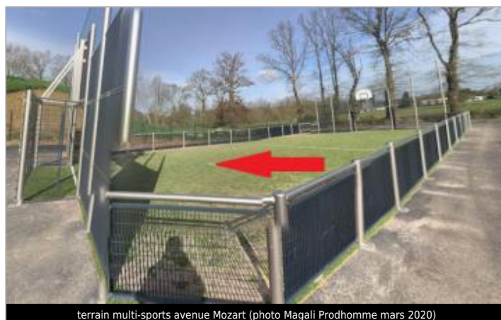
terrain multi-sports avenue Mozart

GÉOLOCALISATION Coordonnées WGS84 : X: -1.63393389 / Y: 48.18710510 Coordonnées RGF93 (Lambert 93) X: 355820.98 / Y: 6797518.49 Coordonnées RGF93 (ETRS89) : X: -1.6339339 / Y: 48.1871051 Code Hydro: J71-0300 Rive de référence: Gauche