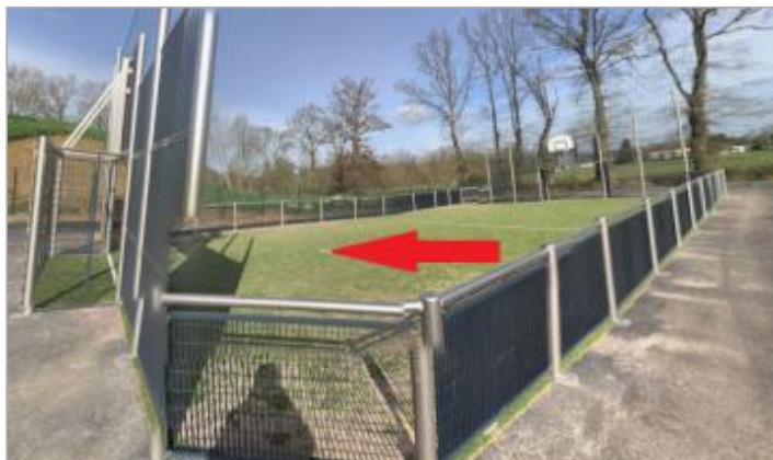
terrain multi-sports avenue Mozart (photo Magali Prodhomme mars 2020)