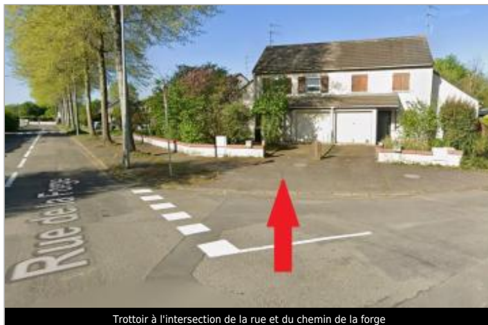
Trottoir à l'intersection de la rue et du chemin de la forge