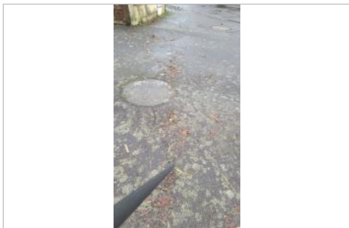
laisse d'inondation sur le trottoir

Altitude calculée de l'eau (en m) : 34.058