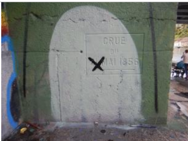
Repère de crue. Photo prise le 22/09/2025