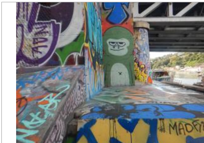
Base du pont SNCF. Coté amont. Rive gauche de la Saône.