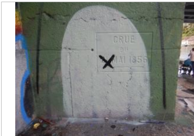
Repère de crue. Photo prise le 22/09/2025