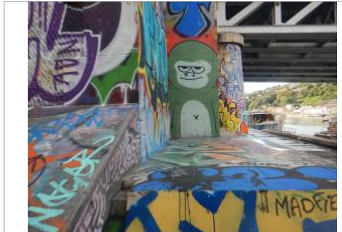
Base du pont SNCF. Coté amont. Rive gauche de la Saône.