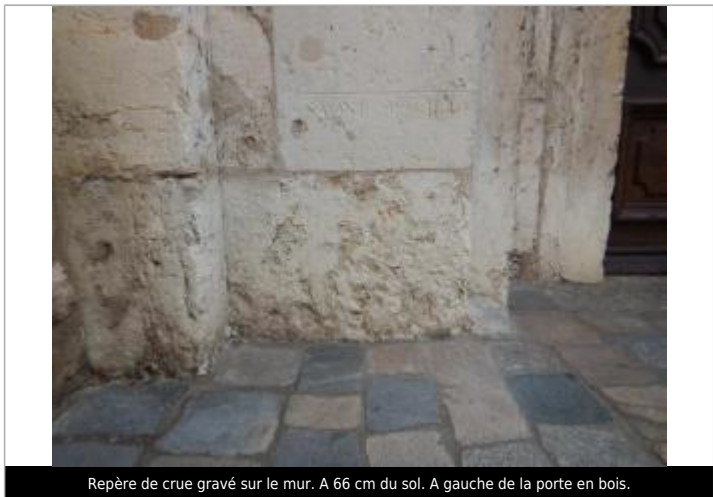
Repère de crue gravé sur le mur. A 66 cm du sol. A gauche de la porte en bois.