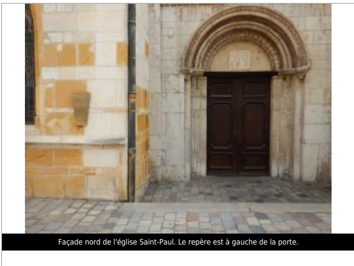
Façade nord de l'église Saint-Paul. Le repère est à gauche de la porte.