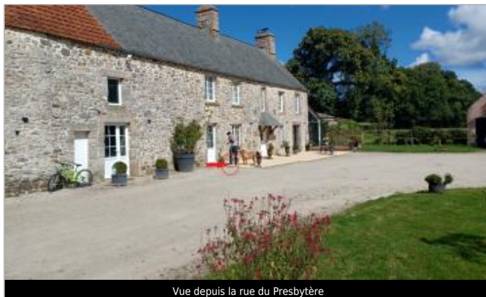
Vue depuis la rue du Presbytère