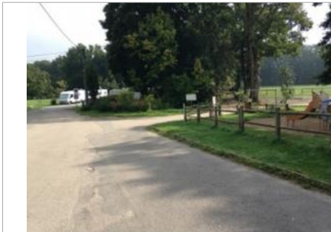
Aires de jeux, près de la maison éclusière