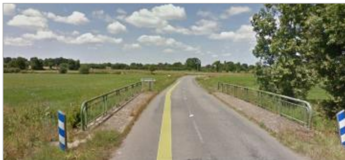
pont de la Mézière sur la RD 34