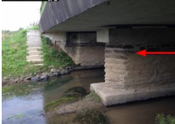
laisse d'inondation sur les piles de pont (boues séchées) (photo DHE)