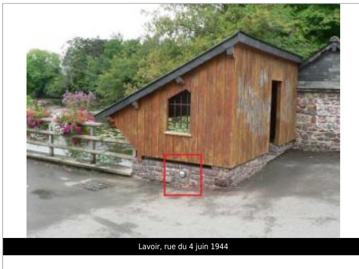
Lavoir, rue du 4 juin 1944