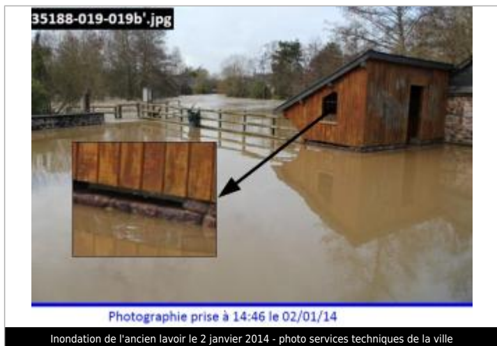
Inondation de l'ancien lavoir le 2 janvier 2014

Maximum de l'inondation : Oui Visibilité : Non État du repère : Moyen Pérennité : Moyenne Repère calculé : Non PHEC : Oui