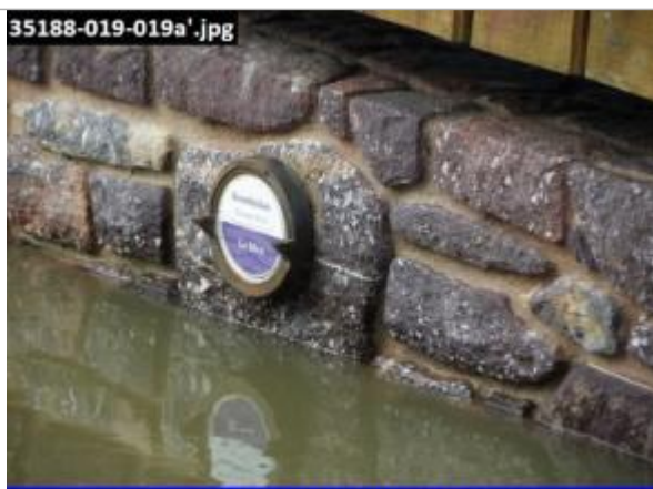
Photographie prise à 14:38 le 07/02/14

Altitude calculée de l'eau (en m) : 33.27 m