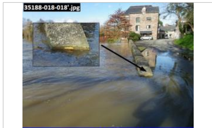
Photographie prise à 14:40 le 07/02/14

GÉNÉRAL Code : 35188-018-018 Date de mise à jour : 04/09/2025 Auteur : SPC VCB