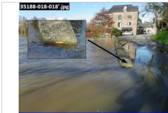
Photographie prise à 14:40 le 07/02/14

Inondation au niveau du muret rue du 11 juin 1944