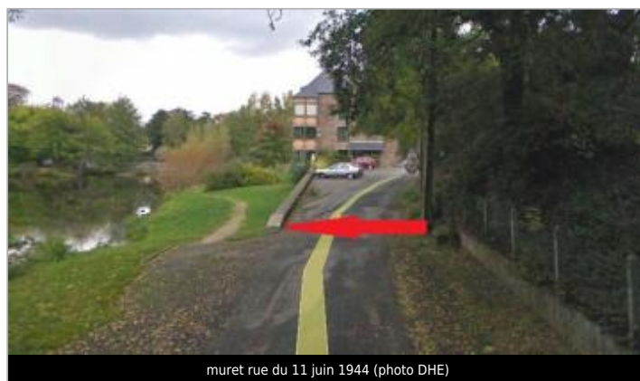
muret rue du 11 juin 1944

GÉOLOCALISATION Coordonnées WGS84 : X: -1.95269265 / Y: 48.13451500 Coordonnées RGF93 (Lambert 93) X: 331809.33 / Y: 6793122.57 Coordonnées RGF93 (ETRS89) : X: -1.9526927 / Y: 48.134515 Code Hydro: J73-0300 Rive de référence: Gauche