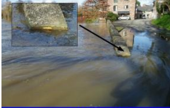
Photographie prise à 14:40 le 07/02/14

Inondation au niveau du muret rue du 11 juin 1944