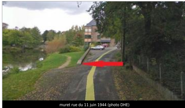
muret rue du 11 juin 1944

Coordonnées WGS84 : X: -1.95269265 / Y: 48.13451500