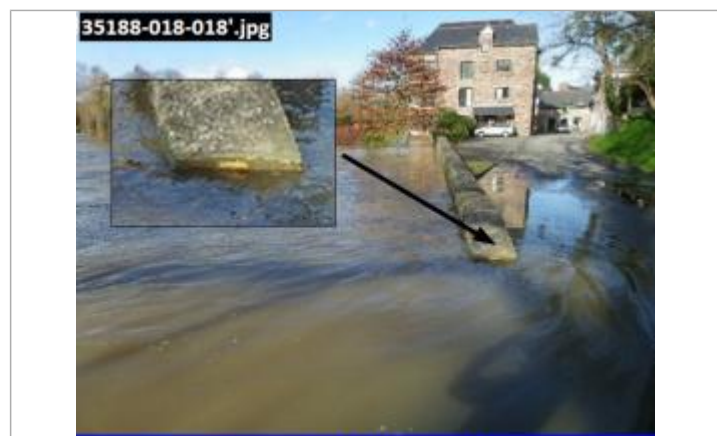
Photographie prise à 14:40 le 07/02/14

GÉNÉRAL Code : 35188-018-018 Date de mise à jour : 04/09/2025 Auteur : SPC VCB