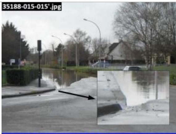
Photographie prise à 15:12 le 02/01/14

Inondation du 2 janvier 2014