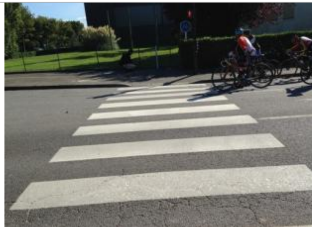
rue de Gaël - passage piéton