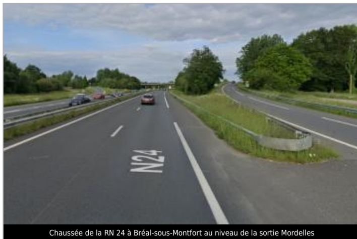
Chaussée de la RN 24 à Bréal-sous-Montfort au niveau de la sortie Mordelles

Coordonnées WGS84 : X: -1.85550881 / Y: 48.06596220