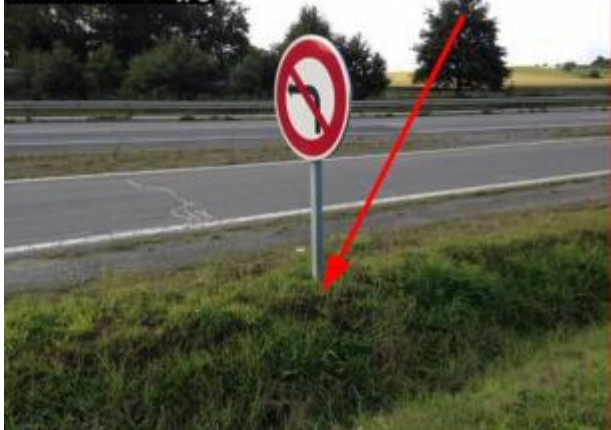
au pied du panneau sens interdit