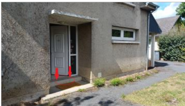
Laisse de crue au niveau du dessus de la dernière marche