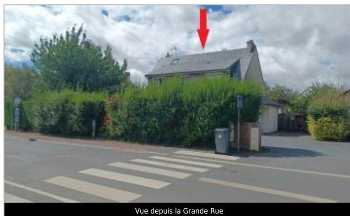
Vue depuis la Grande Rue

GÉOLOCALISATION Coordonnées WGS84 : X: -0.38764575 / Y: 49.15864100 Coordonnées RGF93 (Lambert 93) X: 452952.64 / Y: 6900730.7 Coordonnées RGF93 (ETRS89) : X: -0.3876457 / Y: 49.158641 Code Hydro: Rive de référence: Gauche