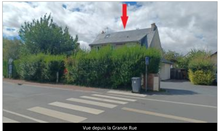
Vue depuis la Grande Rue

Coordonnées WGS84 : X: -0.38764575 / Y: 49.15864100