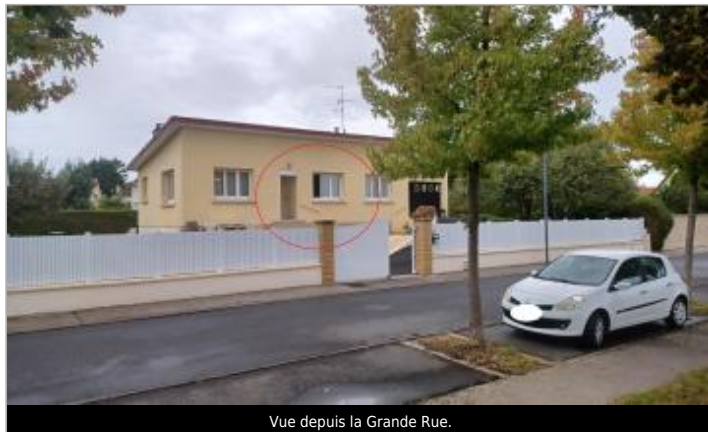
Vue depuis la Grande Rue.