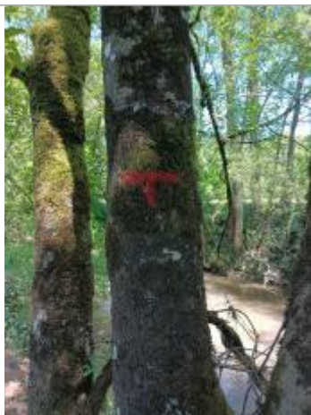
Vue de la laisse - auteur : AGERIN