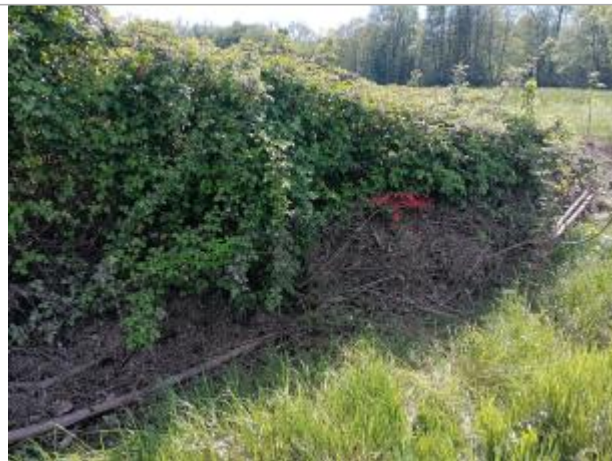
Vue du site - auteur : AGERIN

Coordonnées WGS84 : X: 1.41590090 / Y: 45.28282570