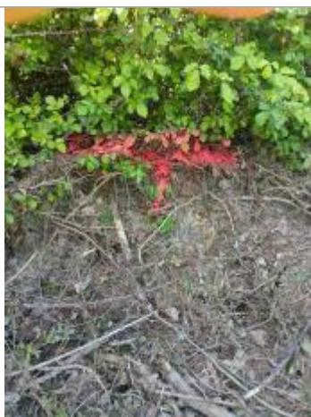
Vue de la laisse - auteur : AGERIN