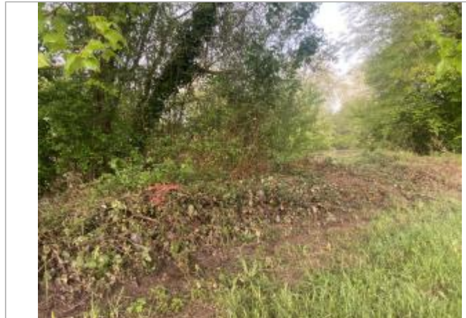
Vue du site - auteur : AGERIN

Coordonnées WGS84 : X: 1.39249140 / Y: 45.13241760