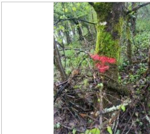
Vue du site - auteur : AGERIN

Coordonnées WGS84 : X: 1.22128150 / Y: 45.10520800