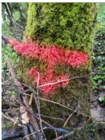
Vue de la laisse - auteur : AGERIN