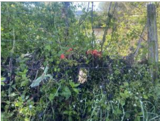
Vue de la laisse - auteur : AGERIN

Altitude calculée de l'eau (en m) : 90.418 m