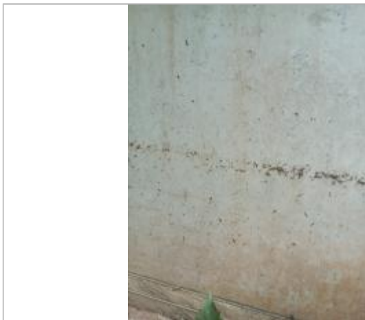
Vue de la laisse - auteur : AGERIN