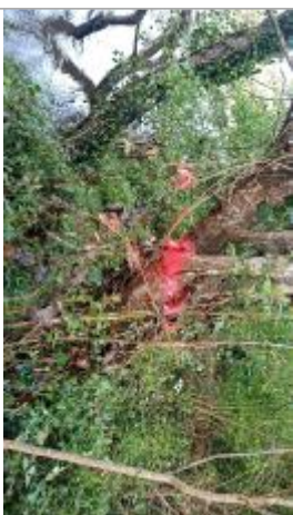
Vue de la laisse - auteur : AGERIN