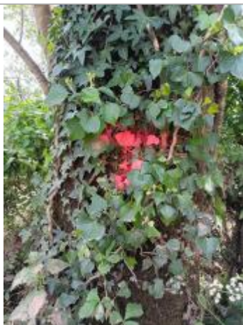
Vue de la laisse - auteur : AGERIN

Altitude calculée de l'eau (en m) : 87.544