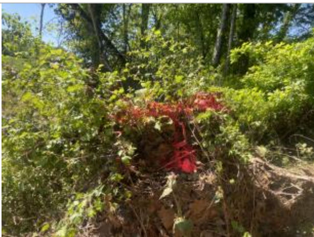
Vue de la laisse - auteur : AGERIN

Altitude calculée de l'eau (en m) : 94.66