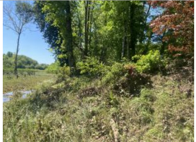
Vue du site - auteur : AGERIN